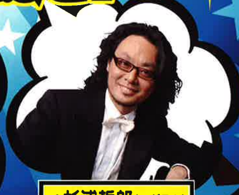
pf 杉浦哲郎(スギテツ)