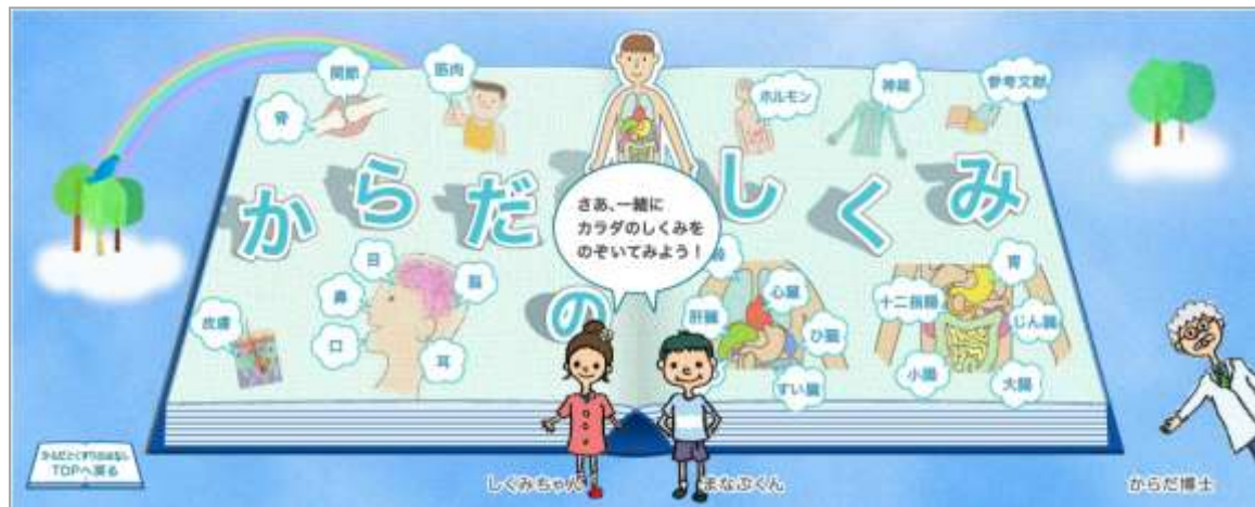
図1 (新) からだのしくみ： http://chugai-pharm.info/hc/ss/medicine/karada/index.html